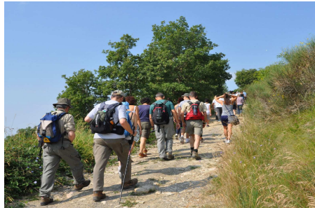
Fratticiola Selvatica (PG) Camminata del 2013