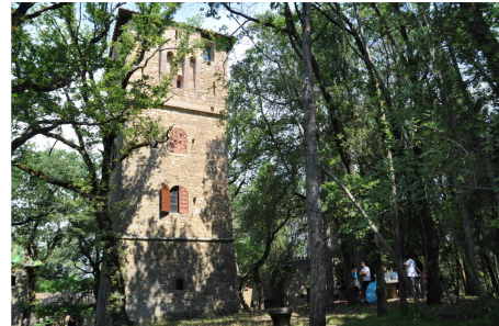
Castello di Verecondo Paoletti - Fratticiola S.

Nella natura e nella Storia..., fra colline, boschi e castelli